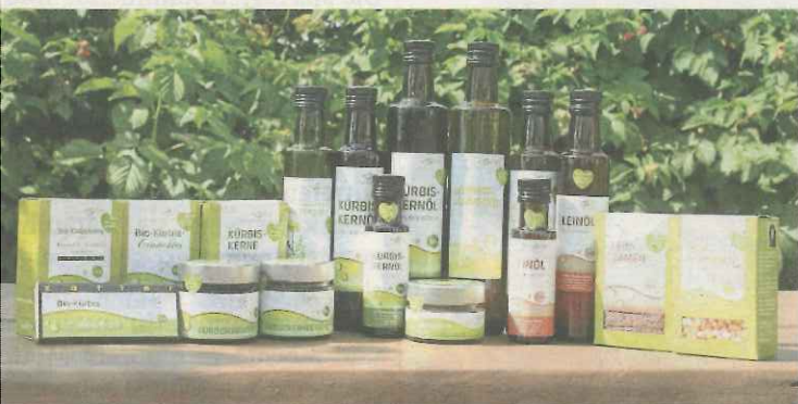
Alles biologisch: Speiseöle, verschiedene Getreidesorten und Kräuterprodukte auf biologischer Basis produziert