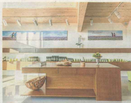
Gutes vor Ort: Seit vergangenem Jahr können Kunden vor Ort die Bio-Produkte erwerben.