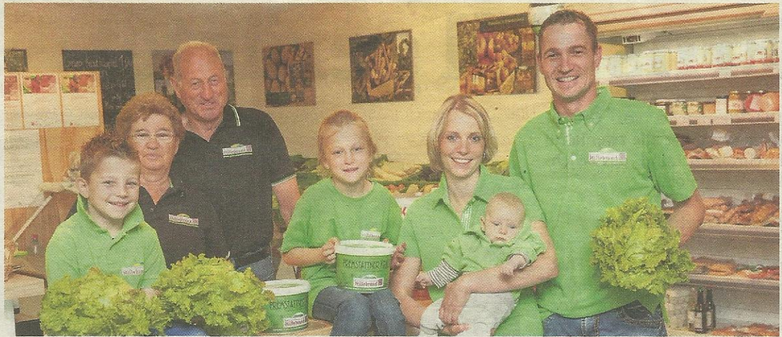
Der Genussbauernhof Hillebrand wird als reiner Familienbetrieb geführt.

örblergasse 111-113 8021 Graz Tel: +43 (0)316 601-511 Fax: +43 (0)316 601-405 Mail: immo@wkstmk.at www.immo707.at