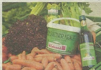
Besonders stolz ist die Familie auf das Premstättnere Kraut, das nur in der Region angebaut wird.

ums Gemüse. Aushängeschilder des Betriebs sind der Grazer Krauthäuptel und das Premstättnere Kraut. Auch, dass die Ware nur saisonal verfügbar ist, zeichnet den Betrieb aus. Unter dem Motto „Schule am Bauernhof“ werden zudem Führungen angeboten. „Wir wollen auch in Schulen Bewusstseinsbildung schaffen“, sagt Hillebrand. LA