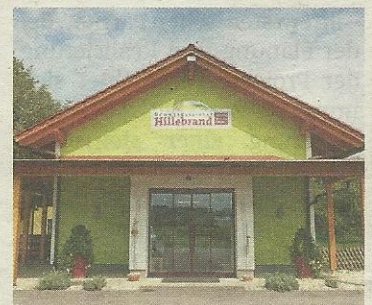
Neben einem Hofladen gibt es auch eine Genuss-Kochschule und Betriebsführungen.

ums Gemüse. Aushängeschilder des Betriebs sind der Grazer Krauthäuptel und das Premstättnere Kraut. Auch, dass die Ware nur saisonal verfügbar ist, zeichnet den Betrieb aus. Unter dem Motto „Schule am Bauernhof“ werden zudem Führungen angeboten. „Wir wollen auch in Schulen Bewusstseinsbildung schaffen“, sagt Hillebrand. LA